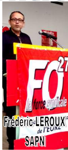
Frédéric LEROUX SAPN de l'EURE