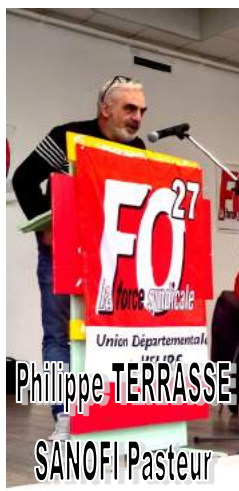
Union Départementale Philippe TERRASSE SANOFI Pasteur