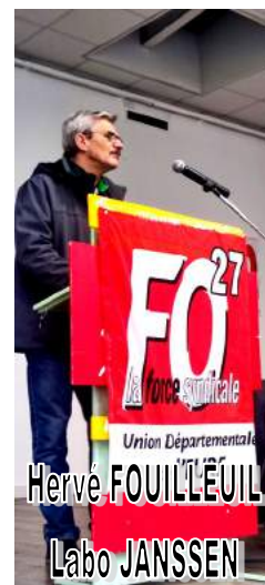
Union Départementale Hervé FOUILLEÛIL Labo JANSSEN