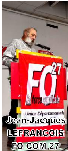
Union Départementale Jean-Jacques LEFRANÇOIS FO COM 27