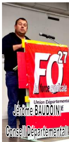
Union Départementale Jérôme BAUDOIN Conseil Départemental