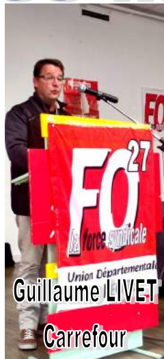
Union Départementale Guillaume LIVET Carrefour