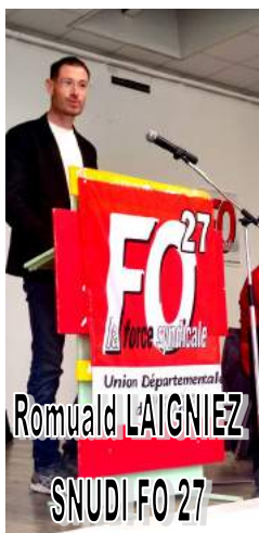
Union Départementale Romuald LAIGNIEZ SNUDI FO 27